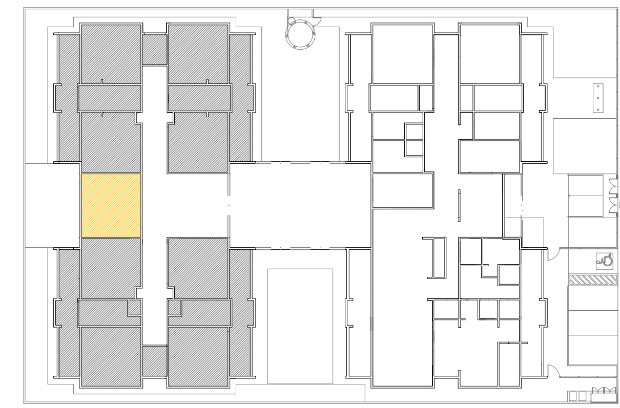
CROQUI DE REFERÊNCIA